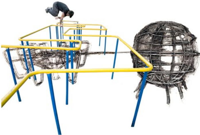
© Catherine Melin, Montagnes Russes, 2010