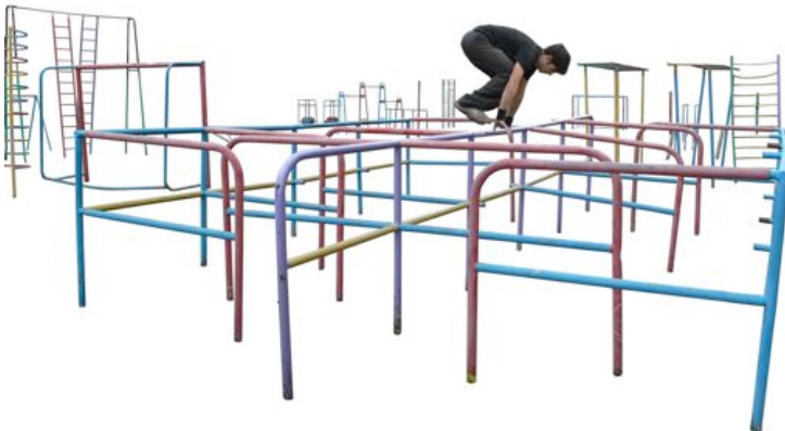
© Catherine Melin, Montagnes Russes, 2010