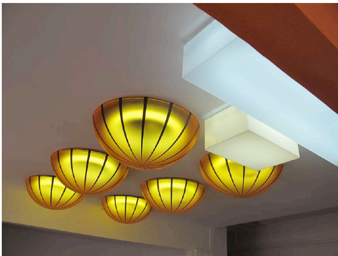
Soubise en Général

Inauguration le lundi 14 novembre 2011 à 17h30