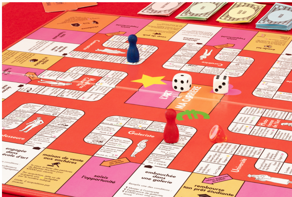
Olivia Hernaiz, L'Art & Ma Carrière , jeu de société, 2020.

Dans le cadre de Sobremesa et de l'exposition Les Heures Sont Là , plusieurs événements sont organisés, à retrouver sur notre site internet: www.artconnexion.org