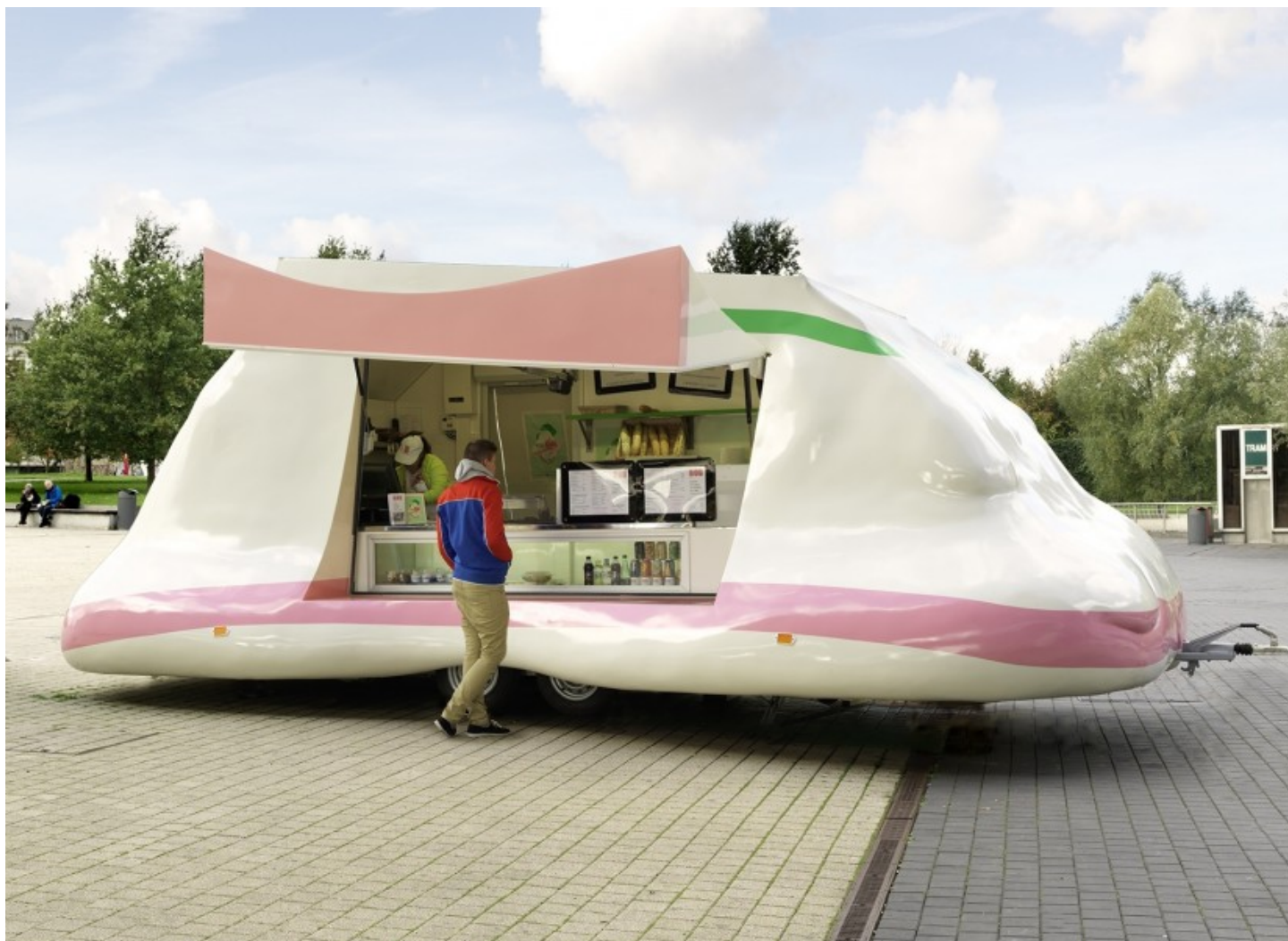
Erwin Wurm, Bob , 2013, Lille.